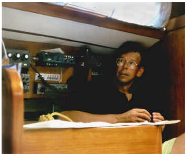
Bild på navigeringsplatsen med radioutrustning.