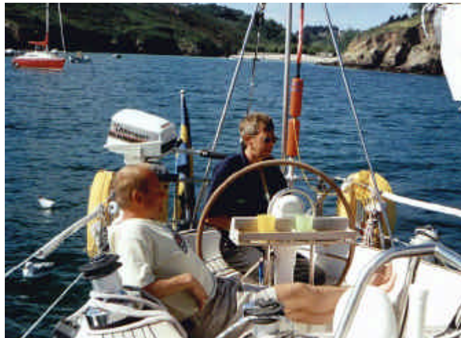
Vilopaus efter ankring utanför Belle-Ille på väg mot Västindien